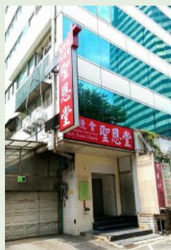
❷ 聖恩堂新會堂外貌