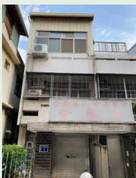
❶ 聖恩堂舊會堂外貌

未來我們期盼，聖恩堂能在這一個家庭結構崩解的世代中，發揮光與鹽的功效，我們會著重弟兄姊妹在聖道上的生命更新、對路德小問答的正確認識與實踐、在家中服事家人並且帶領未信主的家人信主、建立家庭禱告祭壇、鼓勵弟兄姊妹關心陪伴遭遇家庭困難的朋友，願上帝帶領我們在真理中繼續前行。