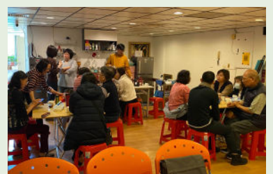
❹ 每個星期主日後愛宴